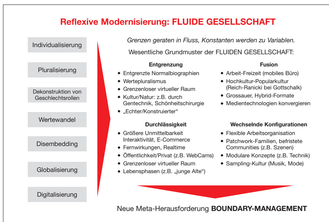
Grafik 1: „Reflexive Modernisierung: FLUIDE GESELLSCHAFT“

An den aktuellen Gesellschaftsdiagnosen hätte Heraklit seine Freude, der ja alles im Fließen sah. Heute wird uns eine „fluide Gesellschaft“ oder die „liquid modernity“ (vgl. Bauman 2000) zur Kenntnis gebracht, in der alles Statische und Stabile zu verabschieden ist.